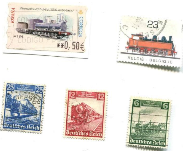
1935, 100 Jahre Deutsche Eisenbahn